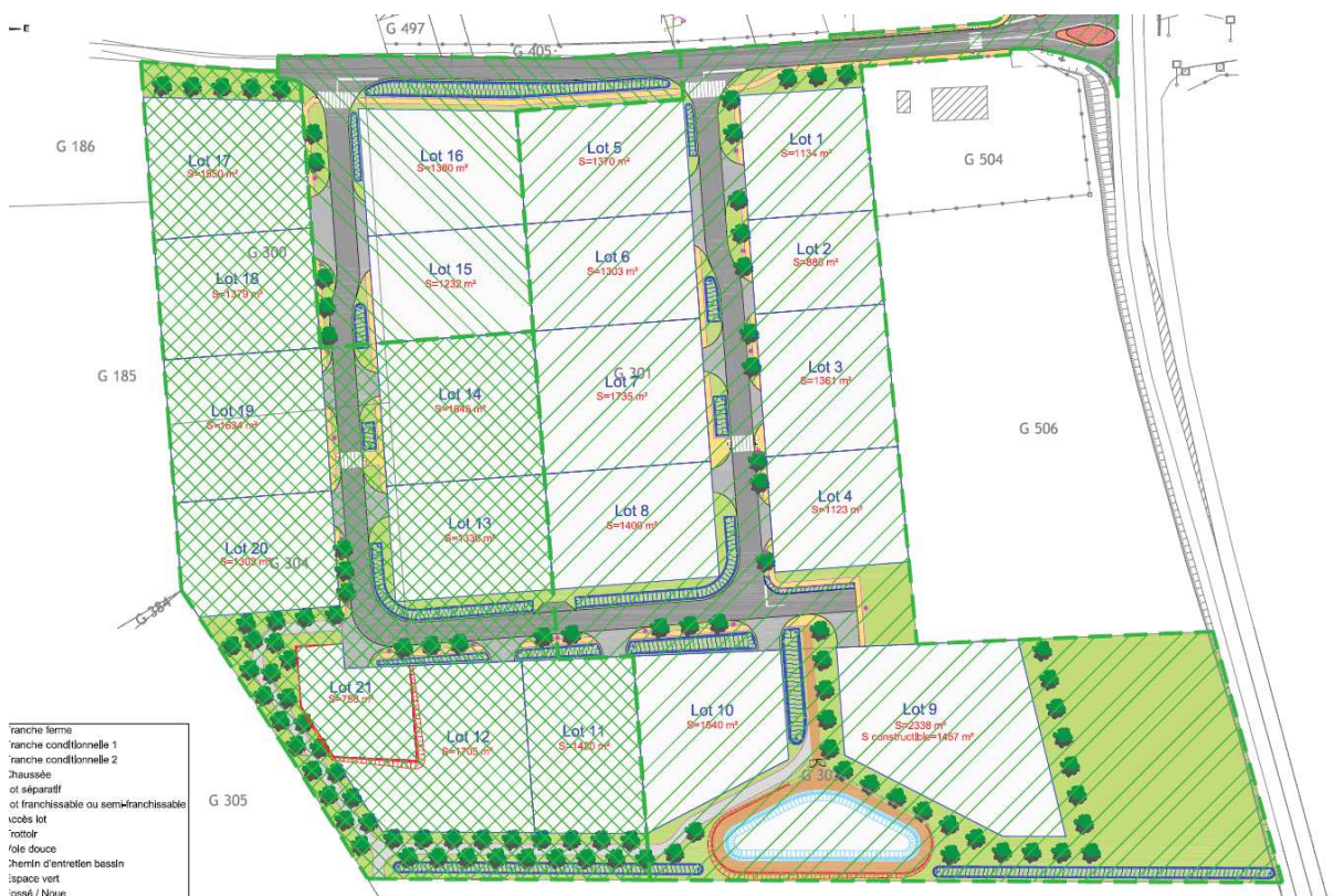
Extrait du projet d'aménagement avant la fusion

Le parti d'aménagement repose sur une structuration simple de 5 hectares.