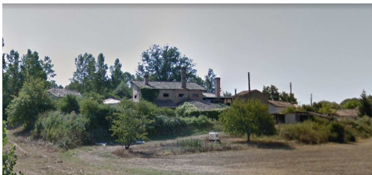
Bâtiments de la tuilerie