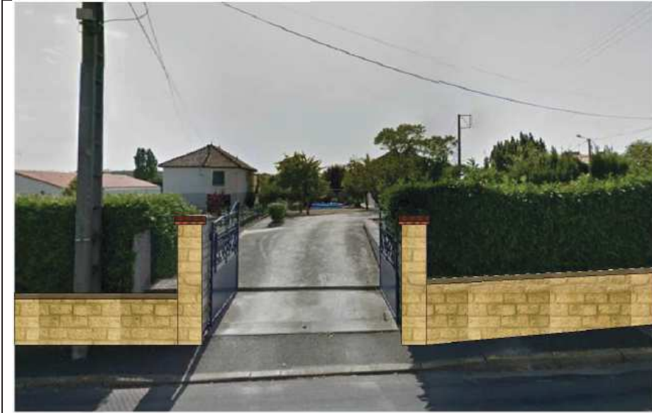
Rue du souvenir Existant