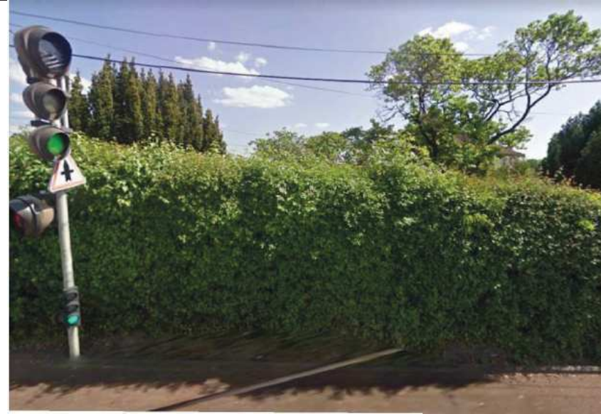
Avenue Wilson : Existant