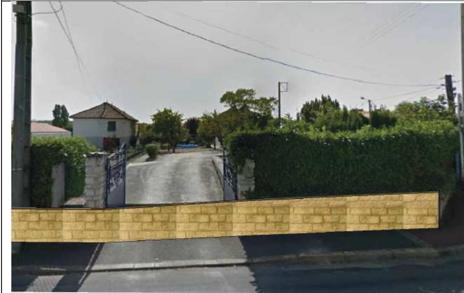
Rue du souvenir : Etat projeté