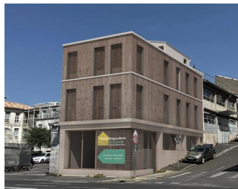
Diagnostic et projection réalisés par Atelier Neyrat Michelet

En date du 22 mai 2024, une présentation du projet a été faite à l'Architecte des Bâtiments de France qui a exprimé un sentiment favorable sur le principe des esquisses et projections réalisés par l'atelier Neyrat Michelet.