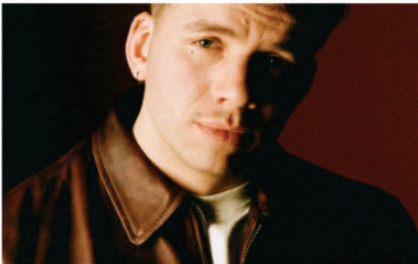
BEN plg sera en concert à La Nef ce vendredi. Reynis CL.

Par Baptiste Racicot, publié le 17 octobre 2024 à 7h00.