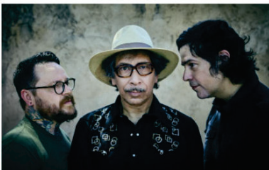
Parmi les groupes qui lanceront la programmation, ce vendredi, à La Nef : KSI Congo & The Pink Monkey Birds (DJ) Julie Desbois

Par Julie PASQUIER - j.pasquier@charentefre.fr, publié le 10 septembre 2024 à 18h34