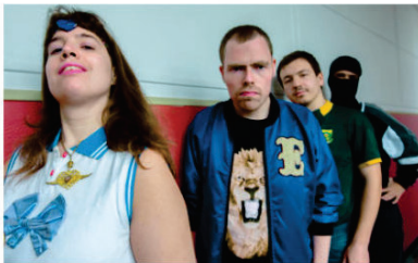
Astérotypie sera à La Nef vendredi 22 mars.

publié le 2 janvier 2024 à 18h55, modifié 20h43.